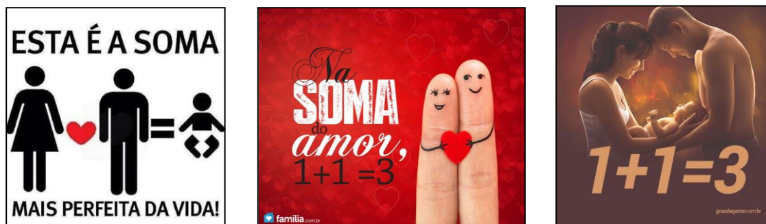
Figura 4 - A soma da vida e do amor

multiplicai-vos pode ser antiga, mas é inegável que ainda seja atual.