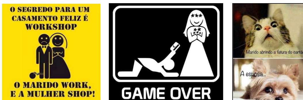
Figura 5 – Homens e mulheres: o que cada um espera do casamento

Mesmo que o casamento seja a ordem natural para a estruturação familiar ele não é visto da mesma forma por homens e mulheres. Se para elas o casamento representa um momento esperado, desejado e sonhado, para eles representa “o fim do jogo” envolvendo mais sacrifício, trabalho e responsabilidades financeiras, o que reforça o papel do homem como provedor da família e o da mulher como perdulária (Figura 5).