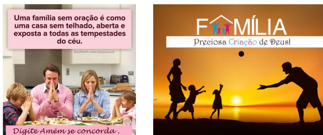
Figura 1 - A Família Facebook

Ao analisar as postagens sobre família nos deparamos com uma família “Facebook” que é constituída invariavelmente pelo pai, mãe e um casal de filhos, raramente outros membros como avós, tios ou primos aparecem. São famílias heterossexuais, brancas e simétricas nas quais não existem problemas, dificuldades ou “desvios” (Figura 1).