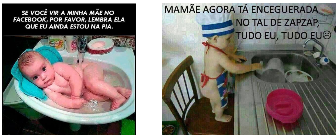
Figura 10 - Mamãe não está cumprindo suas obrigações!

A maternidade como sentimento “instintivo” feminino remete a uma vida de privações, pois entre os “mandamentos da maternidade” estão a renúncia a uma casa limpa, renúncia à vida social, à horas de sono... E essa vida não admite falhas ou distrações. Quando a mãe, por algum motivo, deixa de cumprir suas obrigações elas são severamente lembradas de sua falha (Figura 10).