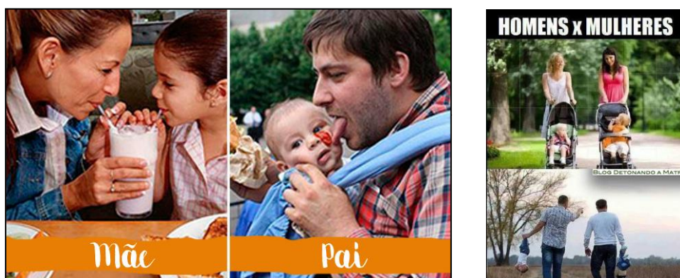
Figura 9 – Pais x Mães

A maternidade como sentimento “instintivo” feminino remete a uma vida de privações, pois entre os “mandamentos da maternidade” estão a renúncia a uma casa limpa, renúncia à vida social, à horas de sono... E essa vida não admite falhas ou distrações. Quando a mãe, por algum motivo, deixa de cumprir suas obrigações elas são severamente lembradas de sua falha (Figura 10).