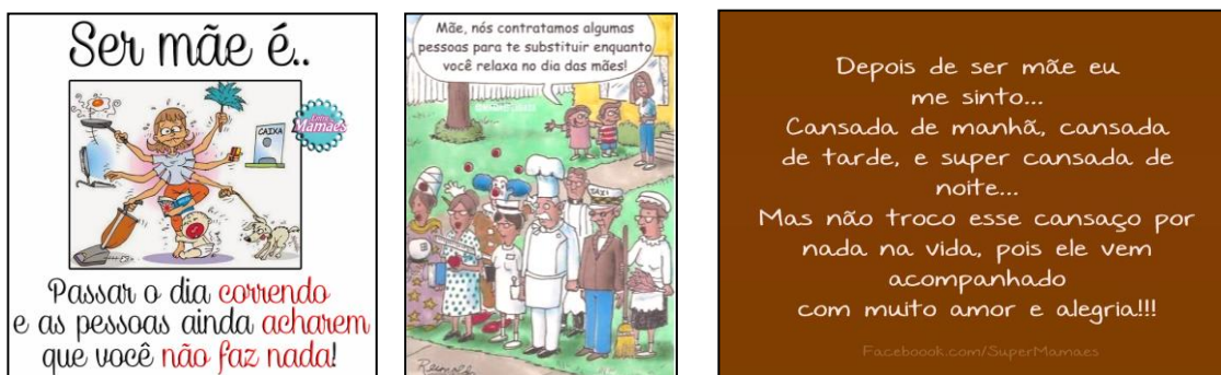
Figura 7 – As múltiplas funções da mãe

A mãe multifuncional (insubstituível e incansável!) é representada em várias imagens. Elas se sacrificam pela família, dispensam momentos de alegria e de descontração para cuidar dos filhos e do marido e suas “obrigações” são realizadas com muito amor, alegria e resignação. Ela não trabalha fora, nunca aparece se divertindo ou fazendo coisas em benefício próprio. Sua vida se restringe aos cuidados com a casa e com os filhos. Ela é cozinheira, faxineira, motorista, professora e apesar de se sentir “cansada de manhã, de tarde e de noite” ela se sente realizada com a maternidade (Figura 7).