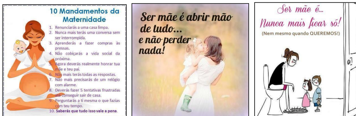
Figura 8 – Ser mãe é...

Nas postagens analisadas o ser mãe supera o ser mulher que abre mão e renuncia à sua individualidade, privacidade e vida social para cuidar total e exclusivamente de sua criança. Cabe à mãe a responsabilidade pela estabilidade e manutenção da ordem familiar. Somente ela pode cuidar adequadamente (e responsavelmente!) da família, é ela que tem que cuidar dos filhos (do marido) e se houver tempo, quem sabe, cuidará de si mesma (Figura 8).