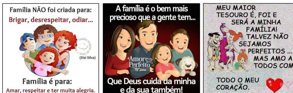
Figura 3 – Família: dom divino, lugar de respeito, amor e harmonia

Nas postagens, não raramente, a família é apresentada como algo divino, uma “preciosa criação de Deus” que deve ser “amada, respeitada”, um tesouro que precisa de cuidados e de total atenção. Numa família não pode haver desavenças, brigas, ódio e nenhum tipo de discussão. O grupo familiar é símbolo de harmonia, amor e respeito. Sendo assim essa família precisa ser respeitada, cuidada, protegida, mas, acima de tudo, preservada (Figura 3).