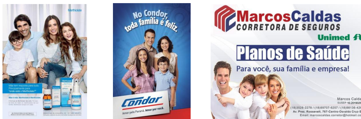
Figura 2 – Família branca, heteronormativa e simétrica

Para Santos (2010) a heteronormatividade (e a branquidade!) faz parte de um sistema amplo e complexo de relações de poder que produzem tanto práticas quanto instituições que, ao assumirem e legitimarem a suposta naturalidade da norma heterossexual e das relações heterossexuais, instituem determinados modos de ser que não precisam estar ditos de forma explícita, mas que operam em distintas redes na cultura (nas relações sociais, nos currículos, nas pedagogias culturais) colocando a heterossexualidade na ordem das coisas, tornando-a invisível. Estamos tão acostumados a essas representações que elas não nos causam mais qualquer tipo de estranhamento.